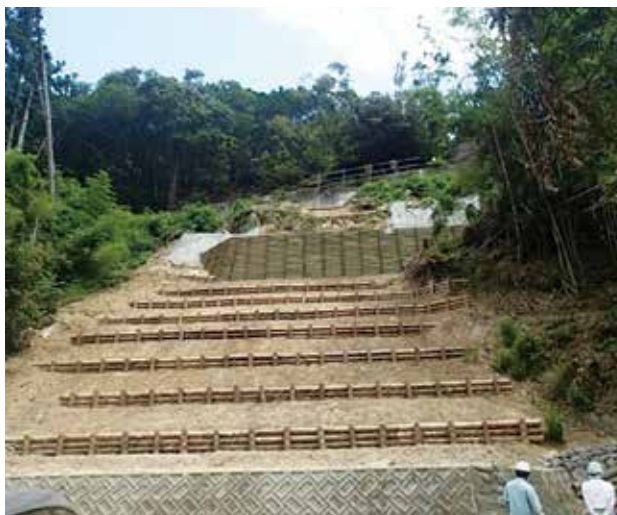
板木工事完成当時 (H29年7月)

板木の現場を見るまでにほかにも数々の現場を見ましたが、ここまで山に戻った状態を見たのは初めてでした。