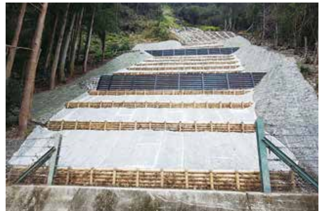
完成した担当工事（室戸市佐喜浜町山口）

令和2年度には工事を受け持つ件数も増え、技術的にも多くを求められることになると思います。そこで経験や知識不足を補うために自分の現場に行くだけでなく、先輩方の現場に積極的に同行したり、様々な研修に参加することで森林土木の技術や知識を身につけて早く戦力になれるよう、精進して参ります。