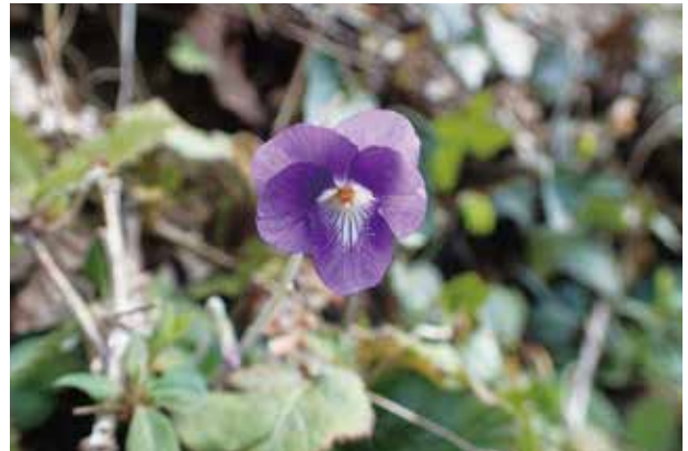
ニオイタチツボスマレ