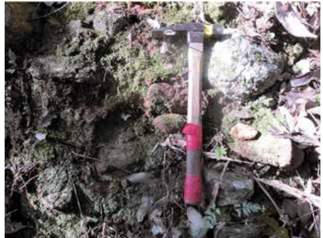
図. 5 図. 4 の A 地点に露頭する玉砂利層