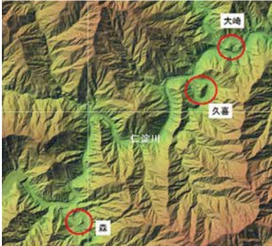
図. 3 仁淀川中流域の蛇行と円錐状地形※ 1

この区間の仁淀川は、そのような地層条件の中を流れるため、比較的軟質な部分を穿入し、それによって複雑に蛇行していったことがうかがえます。