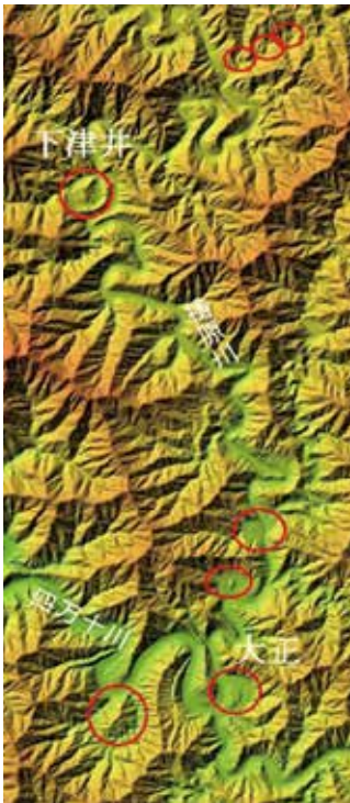
図.1 梶原川下流域の特徴的な円錐状地形 ※1

四万十川水系梶原川の下流域や仁淀川の中流域には、河岸沿いに特徴的な円錐状の小山が見られます。そして、その脚部には裾を取り囲むように谷底状の平地があり山間地域の核となる集落の形成場にもなっています。例えば、梶原川の下流域について