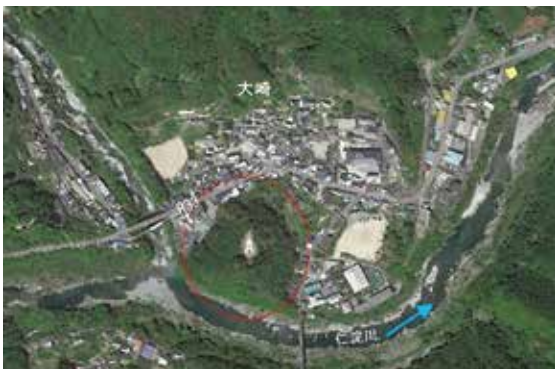
図. 4 仁淀川河岸大崎地区にみられる円錐状地形

図. 4 は、図. 3 中に示したものの1つ「大崎」周辺の航空写真です。図中の赤丸印の範囲が円錐状の小山で、A 地点がその山頂となっています。他の地区と同様、裾を囲むように平坦地が形成されていることが確認できます。この山頂は、仁淀川の河床から約 70m、また裾の平地の高さが河床から 33 mの高さとなっています。図. 5 は、この山頂に露頭する玉砂利層です。仁淀川は、かつてこの高さを流れていた痕跡を示すものであり、また下方の市街地における地質調査においても厚さが 10m 内外の玉砂利層が確認されており、いずれもかつての流路であったことを示しています。