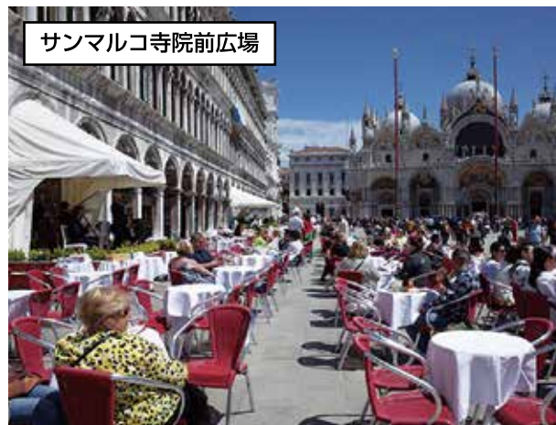
サンマルコ寺院前広場

その結果は…「案ずるより産むがやすし」で余裕をもって出国できました。（写真：次頁 図-1の大運河を望む） 学生時代、テスト前に机に向かい予想した内容が出題されなくても、それなりの得点だったことを思い出します。