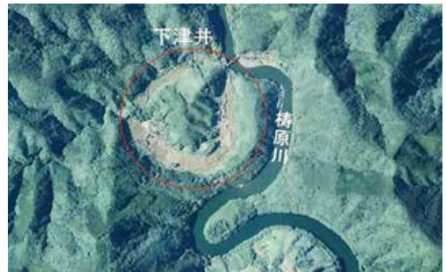
図.2 梶原川の蛇行と円錐状地形

が広がっています。隣接する梶原川の流れを見ると、周辺では穿入蛇行を繰り返し南に流れているのが分かります。この付近の地層は、高知県の南半部を占める四万十帯の北側に分布する下津井層と野々川層と呼ばれる白亜系の地層にあたります。両層は、主に砂岩と泥岩からなり東西方向に互層配列する地層群です。先に述べた円錐状の小山があつて激しい穿入蛇行を示す区間は、梶原川が東西に連なる砂岩・泥岩層部分を断ち切るように南に向けて流れる場所となっています。この激しい蛇行は、固い砂岩部分では地層の配列に従った東西性、砂岩に比較して軟質な泥岩層域では南への流れを基本に形成された、いわゆる適従下流に因ったものであり、その中で起こる浸食に伴って作られた円錐状の小山であることが推考されます。