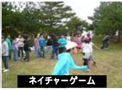
ネイチャーゲーム