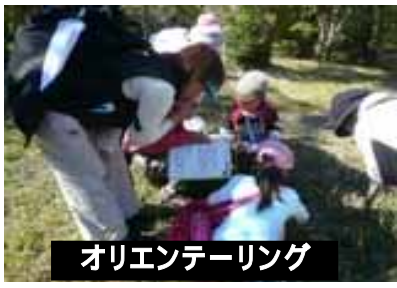
オリエンテーリング