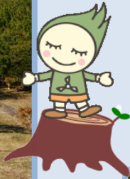
ほく“ほっきー” よろしくね♪

↑パホーンというホーンを合図に、ついに10kmコースのスタート！一斉に山へ向かって走り出しました。それはそれは、すごいスピードで！！