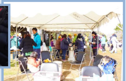
昼食は、地元の“ほっと平山”さん、ボランティアさんの手作りなど♪おいしかったです！