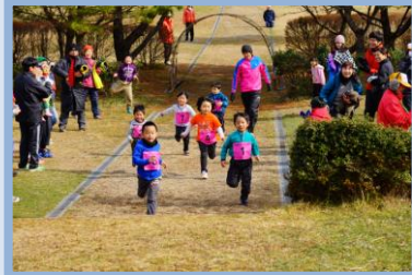
←こちらは、未就学の子もたち。

キッズコースの子ども達の勇姿に、周りの大人の顔がニンニン。うちの子が速い！と心の中で思ってるんだろうなあ～(^_^)