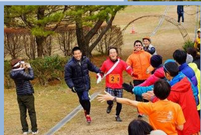
一周約3km、3人でタスキをつなぐリレーコースも行いました！