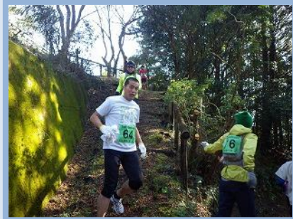
↑林道に出たと思ったら…山の中へ…登ったと思ったら…下り…

↑パホーンというホーンを合図に、ついに10kmコースのスタート！一斉に山へ向かって走り出しました。それはそれは、すごいスピードで！！