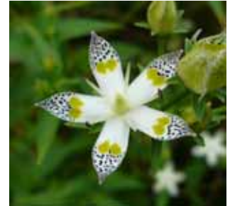
アケボノソウ (リンドウ科 センブリ属)