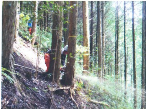
<(図-2) 間伐による森林整備>

平成 23 年度からは、森林整備に対する経験と知識を有している森林組合において、村有林整備を実施するなかで、雇用の安定化と担い手の育成・確保を推進し、森林整備を計画的に実施している。