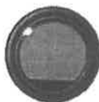
ブッシュ・フィルタ