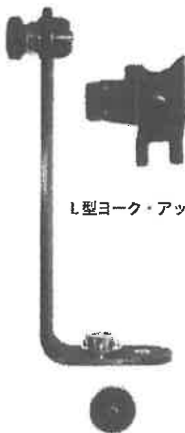
L型ヨーク・アッセンブリー