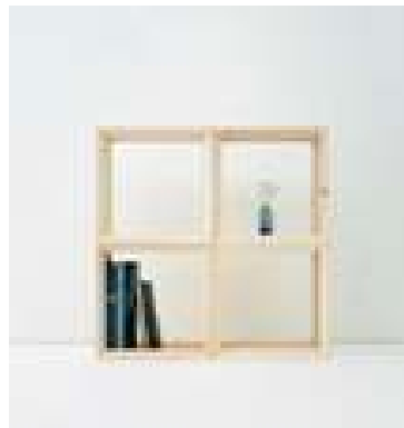
フレーム棚(デザイン：小林幹也)