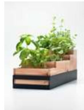
プランター(デザイン：熊谷有記)