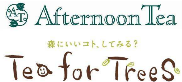
▲Afternoon Tea TEAROOM 「Tea for Trees」