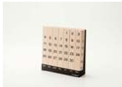
万年カレンダー(デザイン：清水慶太)