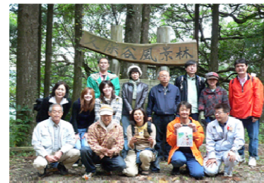
ANA サービス(株)様： エコツアーの飛行機利用