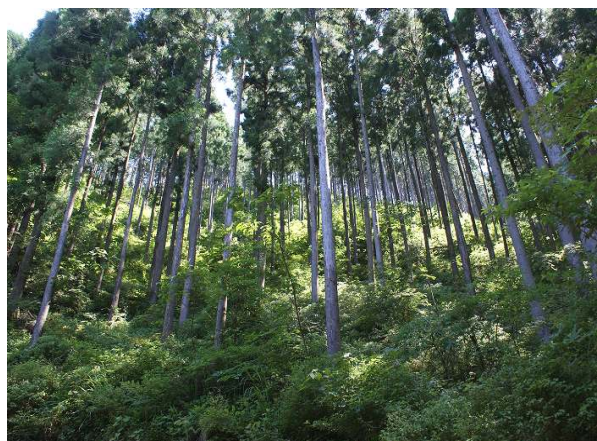
間伐が進んだ森。光がさし、下草も生い茂っている。