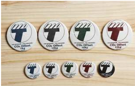
*オフセット認証アイテムの例