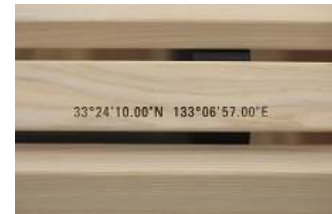
間伐材ベンチ(more trees 賛同人・深澤直人氏デザイン)