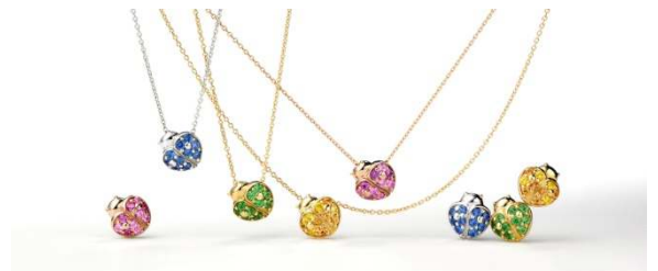
▲ポンテヴェキオ てんとう虫型ジュエリー