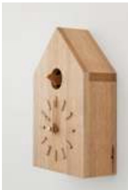
鳩時計(デザイン：深澤直人)