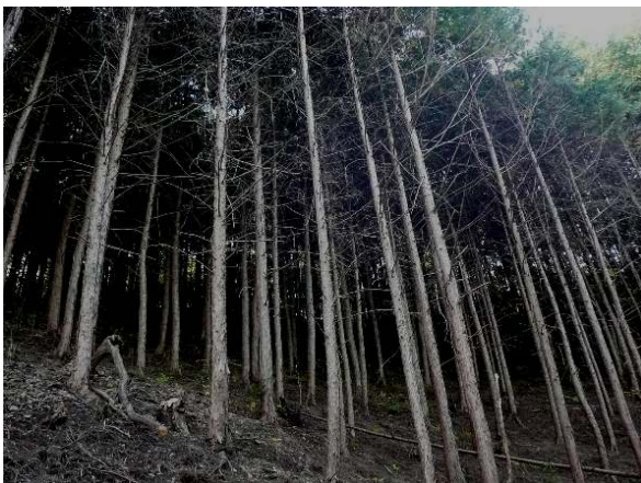
間伐がされていない森。薄暗く、地面に草がほとんど生えていない。

こうした背景から、私たち more trees は、 国内では植林ではなく、間伐を推進しています。 一方で 海外では、植林をメインに活動を進めています。