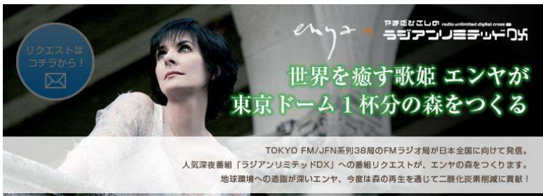
ワーナーミュージック ジャパン様： ラジオのリクエスト1曲につき5kgのカーボンオフセットを実施