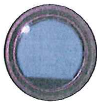
ブッシュ・フィルタ