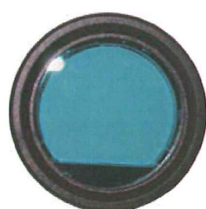
ブッシュ・フィルタ