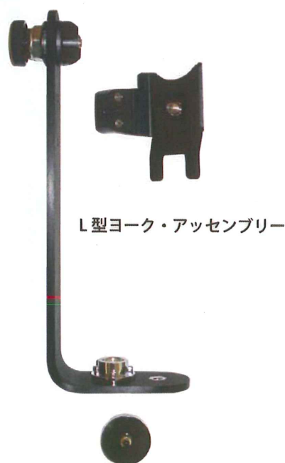
L型ヨーク・アッセンブリー